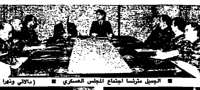
الجميل يترأس اجتماع المجلس العسكري